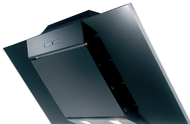
Vampir III Wandhaube