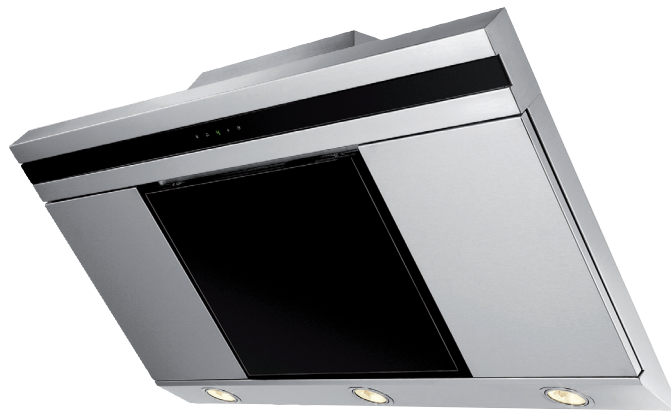
Vampir IV Wandhaube