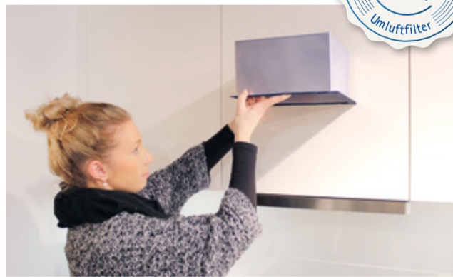
plasmaNorm®-planar – die revolutionäre Filtertechnologie für Flach- und Einbaulüfter