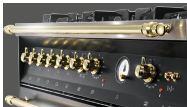
Die präsentierten Lofra Herde sind hochwertig verarbeitet.