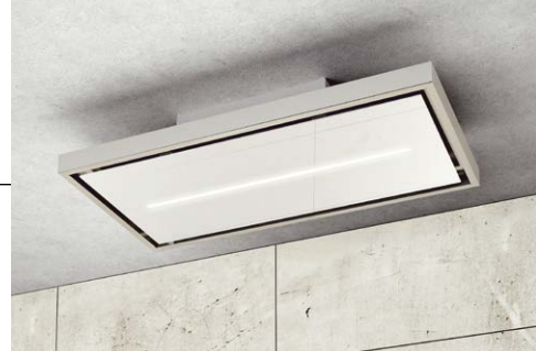
Angenehm unauffällig und leistungsstark – der neue Deckenlüfter Ligo