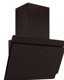
Kompakt über dem Kochfeld, die 60 cm breite Schräghaube Fuga