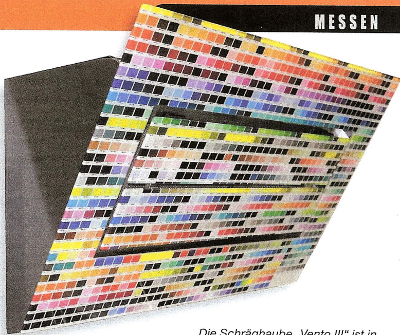
Die Schräghaube „Vento III“ ist in vielen Farben erhältlich.